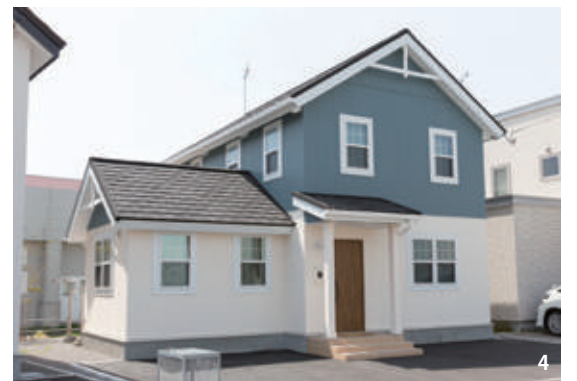
1.奥さまがコーディネーターと相談しながら、インテリアを選んだ(写真はリビングルーム) 2.子ども部屋は、ペーパーミントグリーンの壁紙とナチュラルな木製家具でコーディネート 3.キャンプや釣り、スキーなどのアイテムが整然と並び、ご主人自慢のホビールーム 4.ご夫婦の心をとらえた、甘すぎない外観