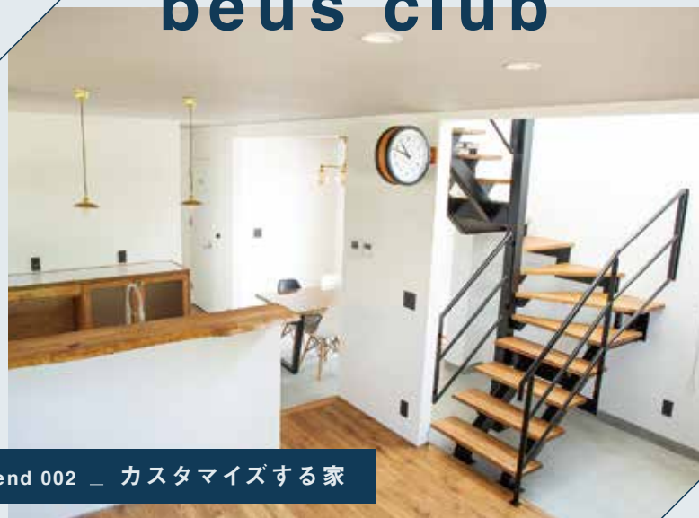
friend 002 _ カスタマイズする家