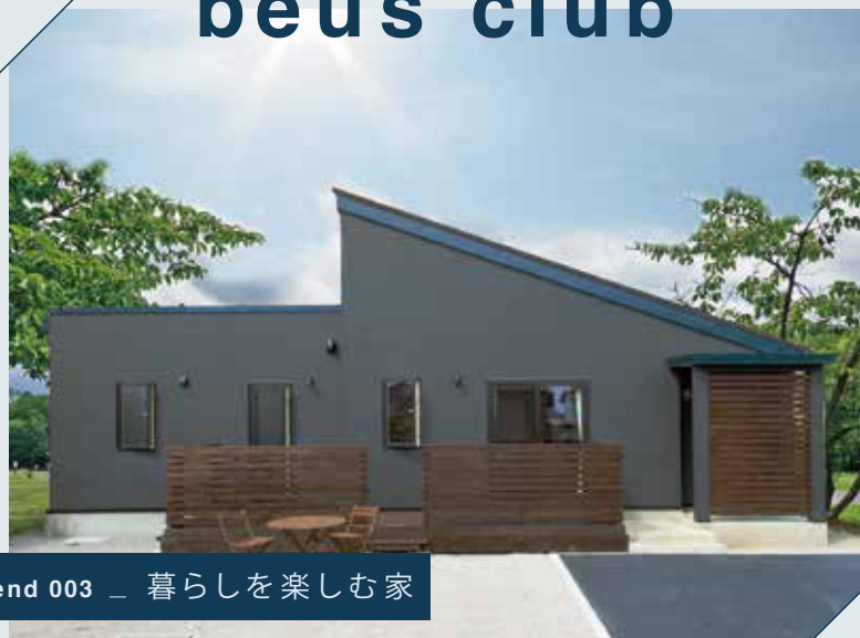
friend 003 _ 暮らしを楽しむ家

2021年秋、beus clubの新しいメンバーとなったオーナーさま邸を訪ねました。