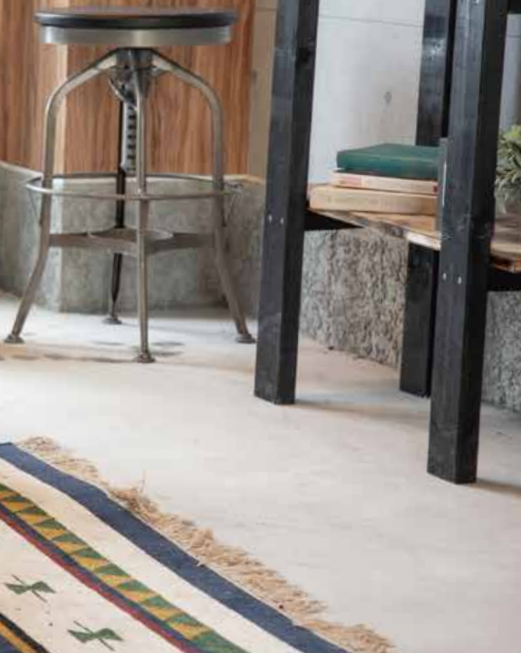
撮影協力/森谷さま夫妻、りく[9歳・バーニーズ・マウンテン・ドッグ]